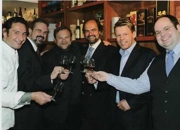
Fernsehkoch und Betreiber der Trinkhalle, Matthias Steiner, freute sich, Namensvetter Matthias Steiner, Olympiasieger und stärkster Mann der Welt im Gewichtheben, im Medici zu treffen und sich mit ihm zu unterhalten. Olympiasieger Steiner war nach der Aufzeichnung zu „Menschen der Woche“ mit den anderen Gästen der Sendung zu einem gemütlichen Beisammensein im Medici. Bild links u. unten