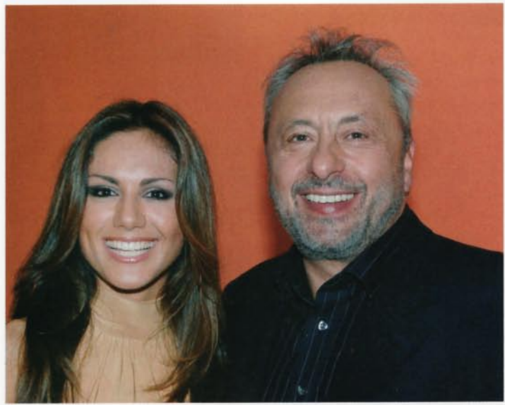
Wolfgang Stumph, alias Kommissar Stubbe, ließ es sich nicht nehmen, sich mit der bildschönen 31-jährigen Moderatorin Nazan Eckes auf einem Foto zu präsentieren